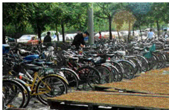
Kinában rengeteg a bicikli

Ha nyerek a lotton vissza megyek a selyem utat végig járni, csak addig tartson ki az egészségem.